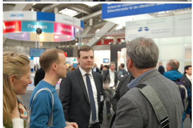
Abb. 2: Impressionen von der Cebit 2016